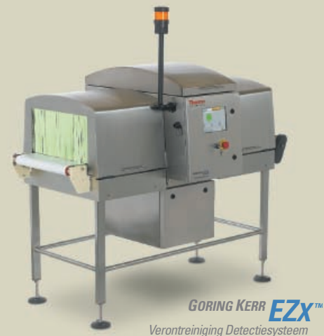
GORING KERR EZX™ Verontreiniging Detectiesysteem