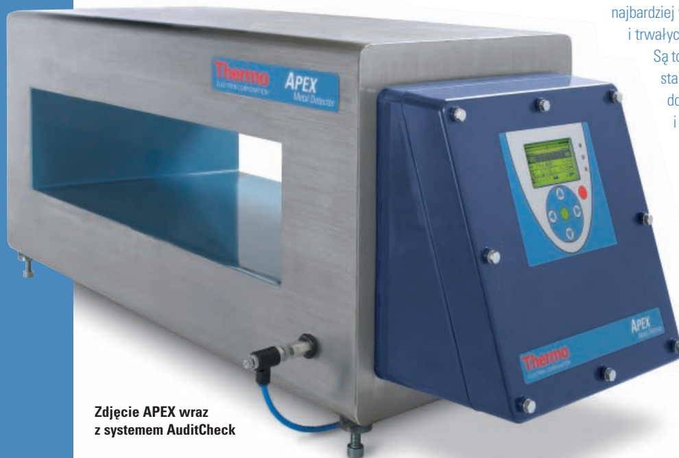
Zdjęcie APEX wraz z systemem AuditCheck

Na dzisiejszym, konkurencyjnym rynku, produkty spożywcze muszą być dostarczane na czas i po konkurencyjnych cenach. Priorytetowe znaczenie ma kwestia bezpieczeństwa produktów, w związku z czym wykrywacze metali są integralnym elementem każdego programu HAACP. Kluczem do zachowania dobrej marki produktów jest stosowanie najbardziej wydajnych, łatwych w eksploatacji i trwałych detektorów dostępnych na rynku.