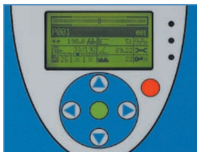
_atwy w eksploatacji panel dotykowy